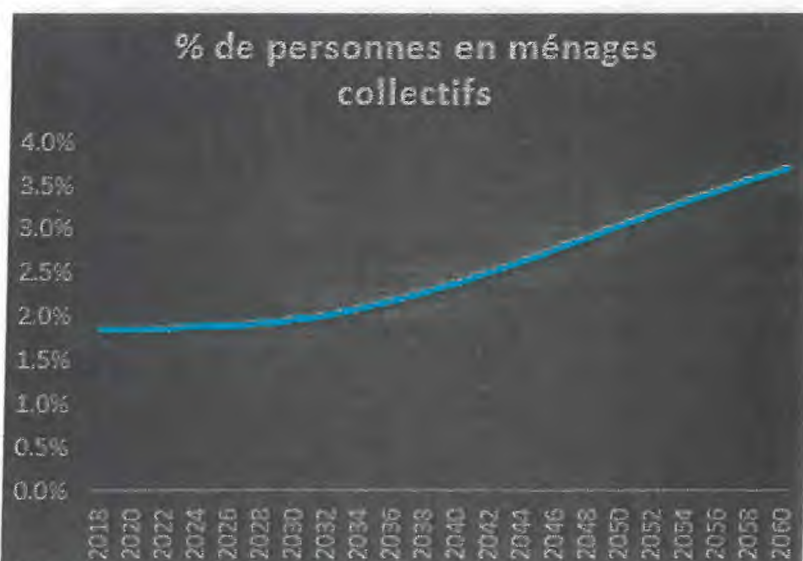
Graphique 2 : Evolution des personnes habitant en institutions

Dans ce contexte, « toutes autres choses égales par ailleurs » et à politique inchangée (en ce qui concerne notamment les services à domicile aux personnes âgées), le nombre de personnes résidant en ménages collectifs 6 devrait considérablement augmenter au cours des décennies à venir, passant de 1,8% de la population en 2018 (11.500 personnes) à 3,7% en 2060 (36.400 personnes). En d'autres termes, le nombre de personnes en ménages collectifs triplerait au cours de cette période.