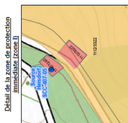
Détail de la zone de protection immédiate (zone I)